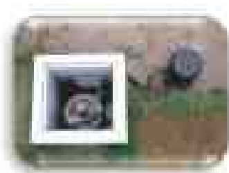
給水栓・取水口の自動化