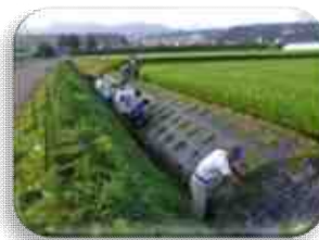
カバープランツ (地被植物)の設置